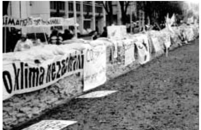
Mehr als 5.000 Jugendliche bauten aus Tausenden von Sandsäcken eine Deichmauer um das Kongresszentrum.

Man erhofft sich jedoch, bei der nächsten Verhandlungsrunde in Bonn nicht wieder bei Null beginnen zu müssen. Die in Den Haag ausgeloteten Schnittmengen sollen festgehalten werden, um daran anzuknüpfen. Ob Georg W. Bush solch eine politische Vereinbarung zur Grundlage für weitere Verhandlungen macht, oder aber eine Brüskierung der Europäer billigend in Kauf nimmt und den vielleicht ge-