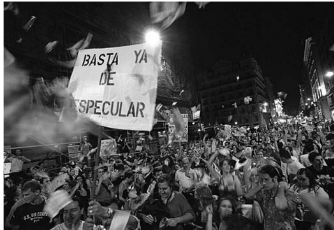
Seit dem letzten Sommer demonstrieren immer wieder Zehntausende in den spanischen Großstädten.

Menschenwürdiges Wohnen und soziale Eingriffe in den Bodenmarkt sind Prinzipien der Spanischen Verfassung, die jedoch nie umgesetzt wurden. Allerdings befindet sich der Immobilienmarkt in Spanien in einem Spekulationsboom. Im Basenland z.B. stiegen die Hauspreise zwischen 1995 und 2005 um 250 %. Das können immer mehr Leute nicht bezahlen. Junge Menschen müssen lange auf den Bezug einer eigenen Wohnung warten. Minderheiten werden bei der Wohnraumversorgung systematisch diskriminiert. Zugleich blühen die Bau-Korruption oder die Spekulation mit Wohnraum. Lokale Gruppen in Barcelona berichten von anhaltenden Schikanen gegen die Mieter, von Abrissen gegen den Protest der Nachbarschaft, Missachtung von alternativen Bauvorschlägen und Zwangsräumungen. "Immobilien-Mobbing" nennen es Aktivisten. "Es ist eine Schande für Spanien", sagte Kothari im katalanischen Fernsehen bei einem Besuch im einstigen Armen-Viertel Raval in Barcelona.